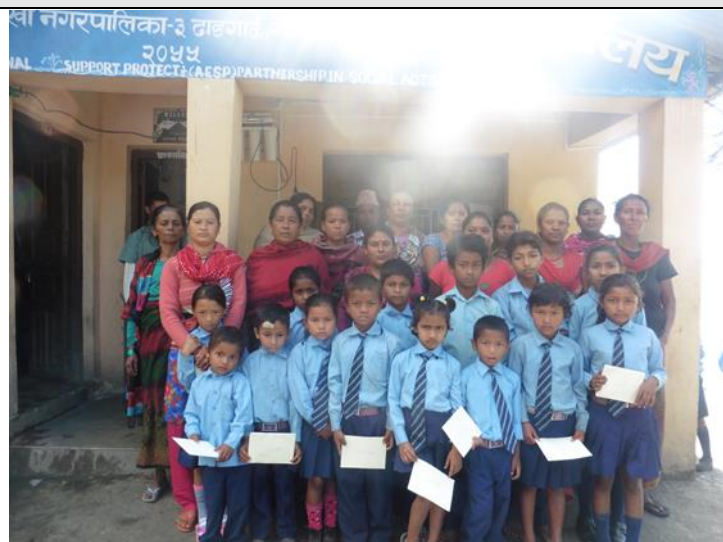
PN school 助學金卡片發放