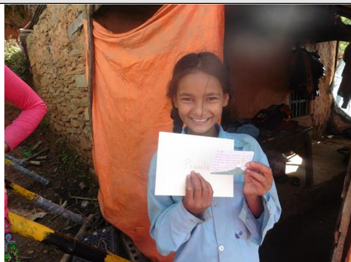
學童與資助人卡片