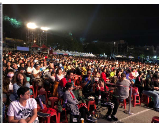
▲日月潭客運站前的廣告文宣▲音樂會人潮