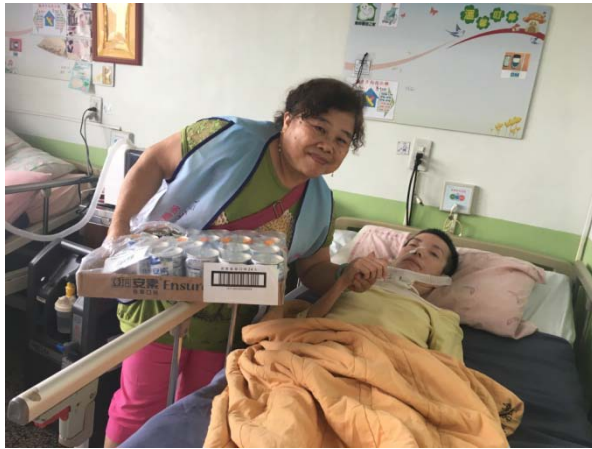
▲理事前往機構探視會員並致贈管灌營養品