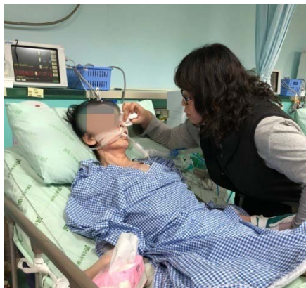
▲社工前往機構探視關懷臥床病友