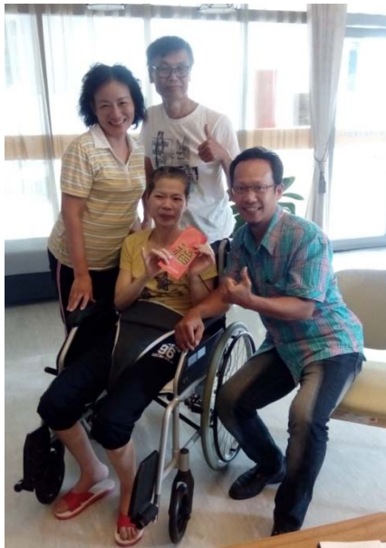
▲時逢端午佳節，民生物資與關懷為病友帶來溫暖