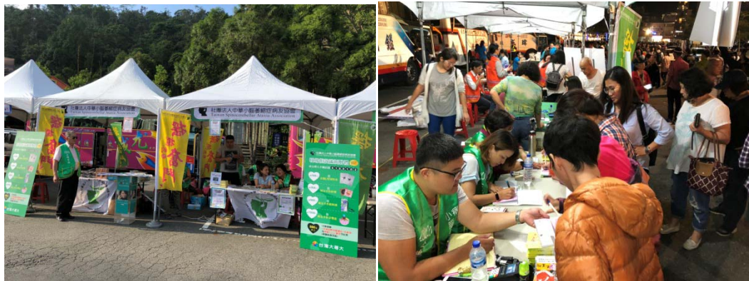
▲音樂會下午設攤狀況