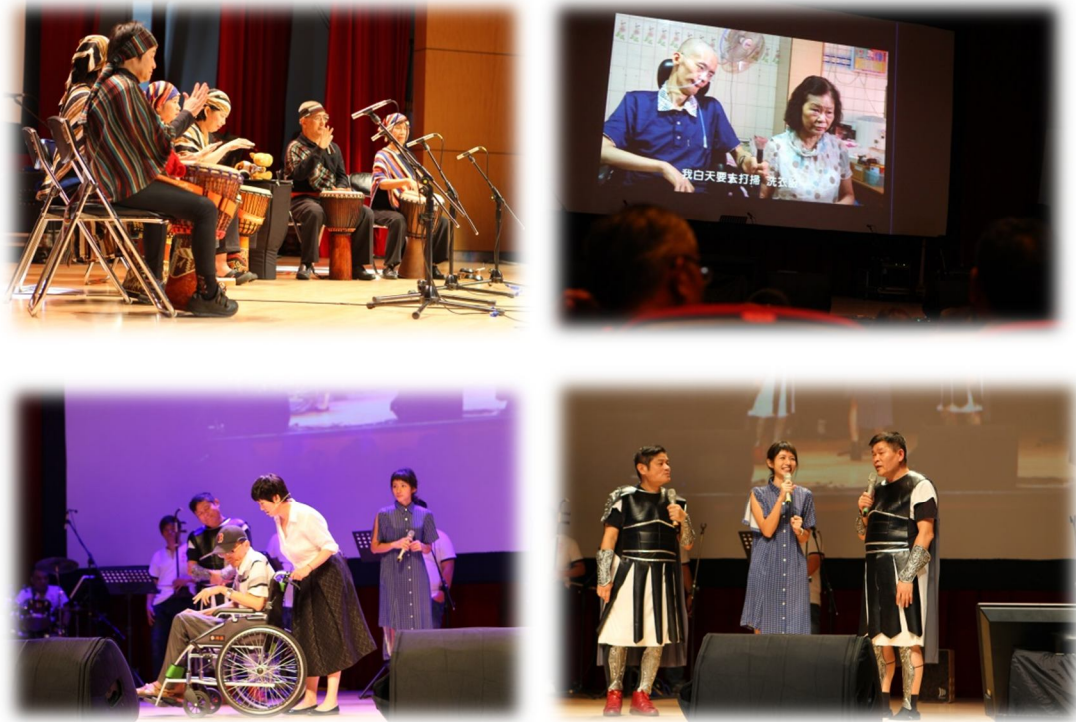
▲公益慈善晚會現場