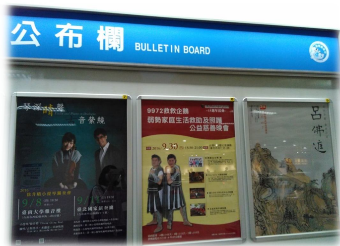
▲台北車站捷運站活動文宣