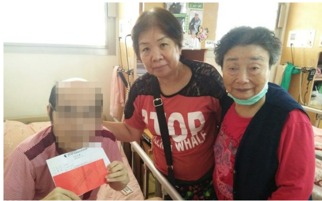
▲理事前往機構探視會員並致贈禮金