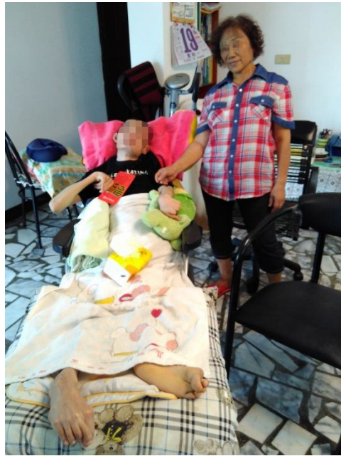
▲補助款與營養品讓臥床病友能維持基本生活品質與營養